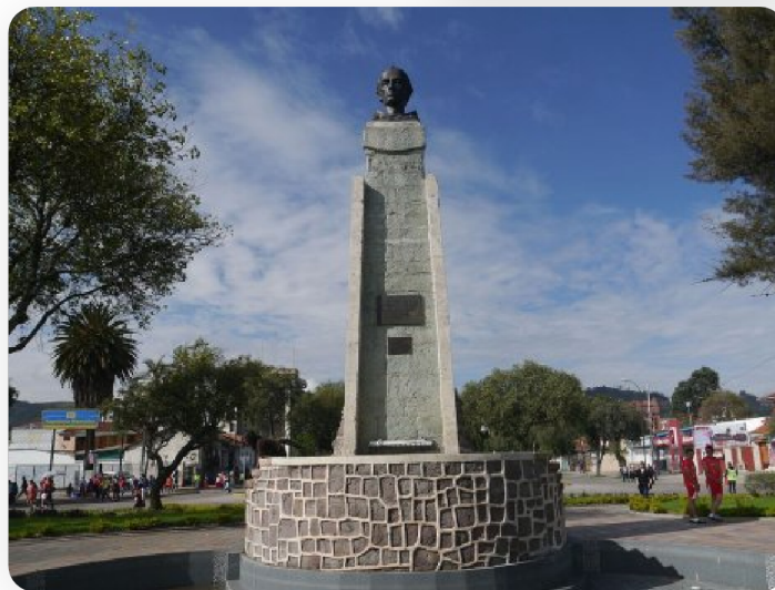
Monument à la mémoire de Frère Vicente Solano - Cuenca